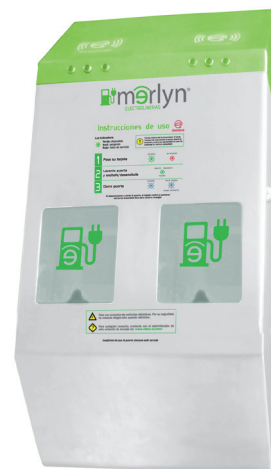
Evo4 pared dos conectores independientes