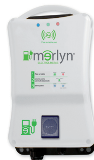
Evo5 pared tipo «wall-box» para garajes privados